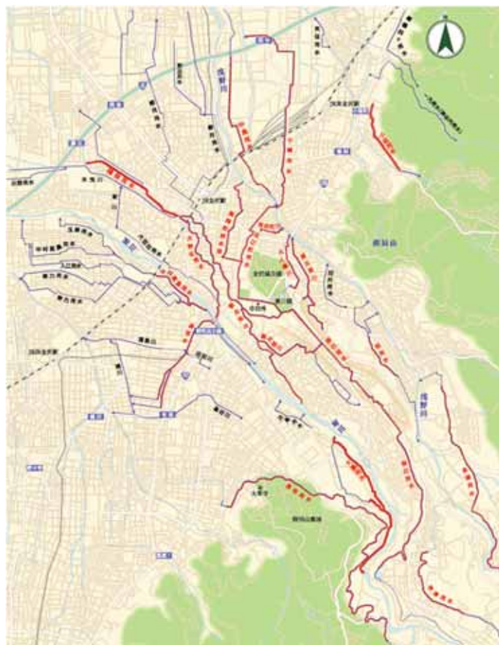
図 金沢の用水マップ

http://www.city.kanazawa.ishikawa.jp/keikan/yousui/yo_map.html ）