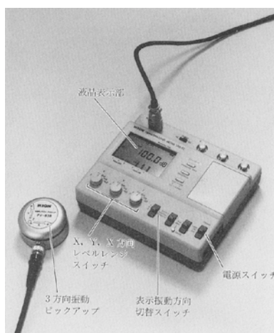
図 振動レベル計と振動ピックアップ